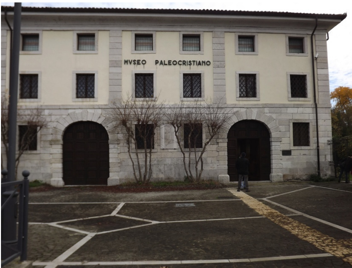
EX CONVENTO ORA MUSEO